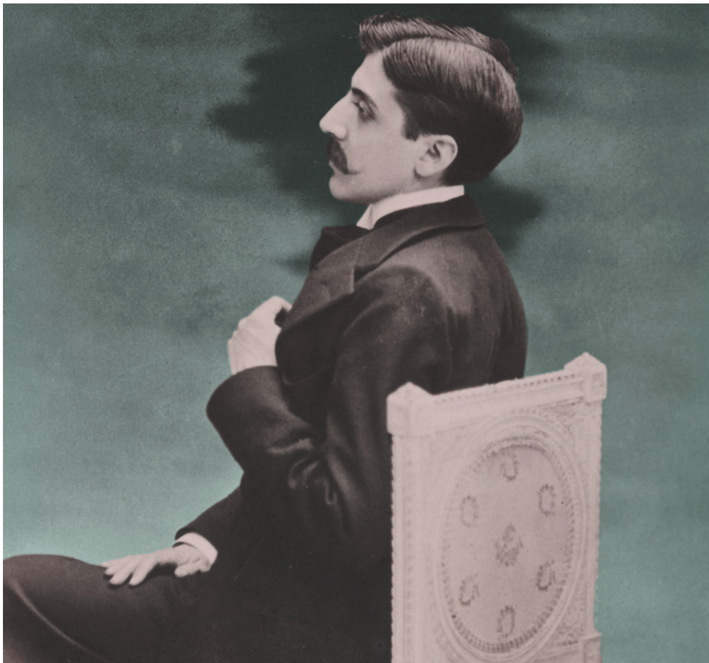
Marcel Proust par Otto Wegener, dit Otto, 1896, Maison de Tante-Léonie - Musée Marcel-Proust